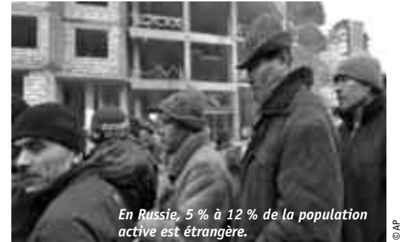
En Russie, 5 % à 12 % de la population active est étrangère.

L'écrasante majorité – 94 % des 230 000 – des personnes ayant quitté l'Arménie entre 2002-2007, étaient des migrants à la recherche d'un emploi plus rémunérateur dans le but d'améliorer les conditions de vie de leurs familles restées en Arménie. Durant cette période, 90 % d'entre eux ont été en mesure d'en trouver un. Ces migrants se situent dans la tranche d'âge