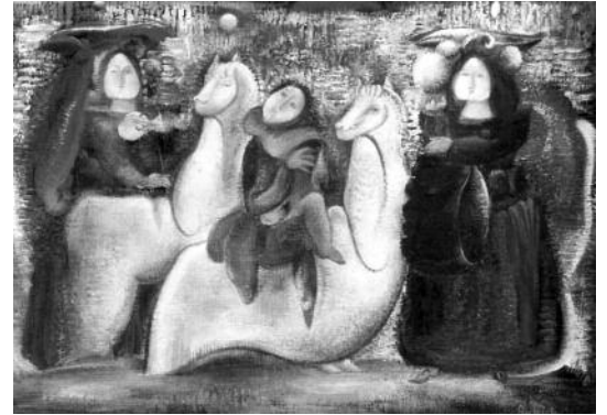
Jongleurs roux et poupée qui danse, 1976