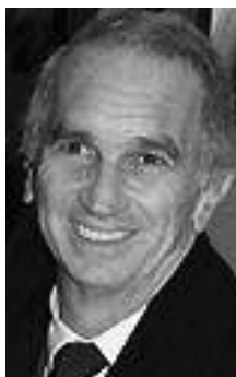
Souhaitons longue vie à L'Abricot d'or.

D'autre part, cette année un programme d'information « Produit en Arménie » montrait les films tournés ces dernières années par le Centre national cinématographique d'Arménie et le studio des films documentaires « Hayk ».