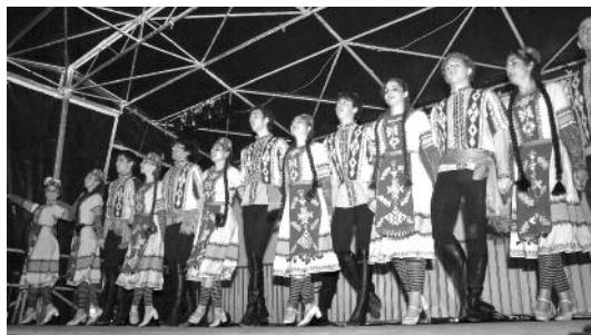
La troupe Ani