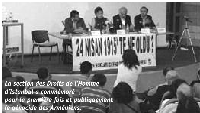
La section des Droits de l'Homme d'Istanbul a commémoré pour la première fois et publiquement le génocide des Arméniens.