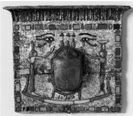
Ornement funéraire (Pectoral) représentant la régénération du soleil, Nouvel Empire, fin 18 e dynastie- 19 e dynastie. Paris, musée du Louvre.

L'exposition rassemble quelque trois cents pièces issues des collections du Louvre et des chefs-d'œuvre venus des grands musées européens pour compléter cet ensemble remarquable.