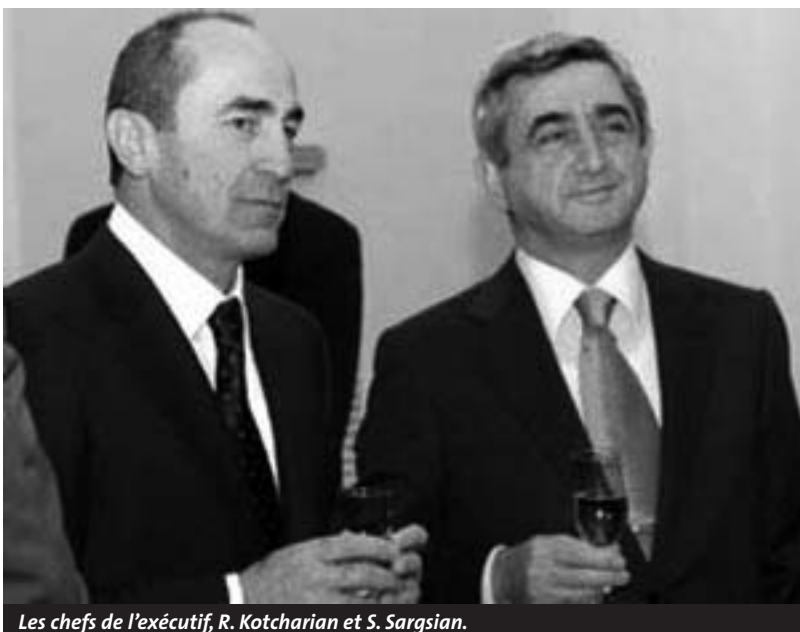
Les chefs de l'exécutif, R. Kotcharian et S. Sargsian.

Réponse à Aliev : « J'exclus la possibilité d'une solution par la force », a affirmé Serge Sargsian, qui prendra sa fonction de président le 19 avril