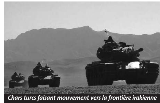
Chars turcs faisant mouvement vers la frontière irakienne

L'incursion turque dans le nord de l'Irak « devait être courte et la plus ciblée possible », avait insisté le secrétaire américain à la Défense. « Nous n'avons aucune intention de rester », avait répondu son homologue turc. Finalement, l'incursion aura duré cinq jours. En l'absence de calendrier sur la durée des opérations militaires, l'inquiétude commençait à gagner Washington partagé entre la hantise de l'escalade et la nécessité de ménager la Turquie, canal vital pour le ravitaillement des forces déployées en Irak.