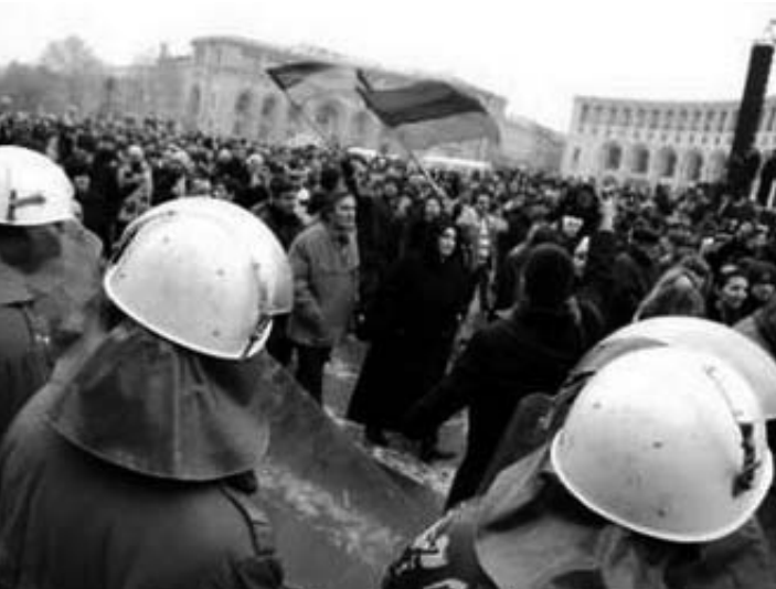
Le face à face troupes anti émeutes-manifestants

Plus brutal, Levon Ter-Petrossian , l'organisateur de la contestation, utilisa des adjectifs très durs, excessifs, à la limite de l'insulte, à l'encontre du président de la république et de son encore Premier ministre. Était-ce nécessaire ? Cela apparaît aujourd'hui comme une erreur psychologique et politique grave de la part de celui qui exerça le pouvoir absolu pendant huit ans. Sous-estimant ou feignant de sous-estimer la capacité et la volonté de réaction du pouvoir, Levon Ter Petrossian l'a provoqué par le verbe. Et l'on connaît la puissance des mots, leur impact sur les foules confiantes. On aura été frappé par les termes qu'il a employés pour attiser le mécontentement : régime à la Saddam Hussein, tricheur, fraudeur, manipulateur, assassin ou