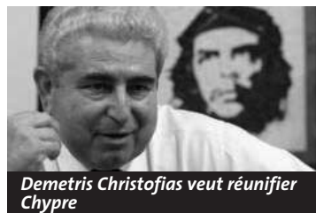
Demetris Christofias veut réunifier Chypre

caisses de son parti. En vérité, les communistes chypriotes ont toujours été plus des pragmatiques que des idéologues. Ce qui explique pourquoi son parti constitue encore une force politique majeure tant d'années après la chute du bloc soviétique. En fait, une majorité d'électeurs chypriotes voit Christofias comme un communiste réformateur. Elu sur la promesse d'une nouvelle politique pour mettre fin à 34 ans de division de l'île, le candidat communiste prône une réunification avec la partie turque de l'île. Il a formé un gouvernement de coalition où le commissaire européen à la Santé, Markos Kyprianou, est devenu ministre des Affaires étrangères.