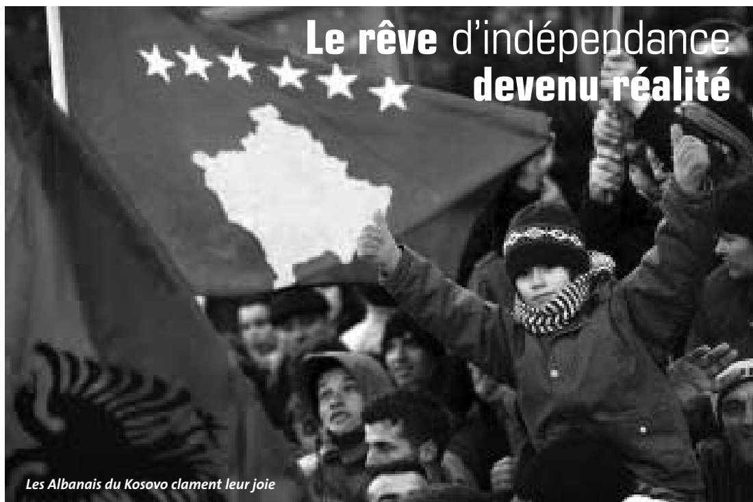
Les Albanais du Kosovo clament leur joie

Dimanche 17 février 2008, à Pristina, la capitale kosovare, le Kosovo a proclamé son indépendance de manière unilatérale au cours d'une session parlementaire extraordinaire. Les députés ont approuvé le texte à main levée et à l'unanimité. « Le Kosovo est désormais un Etat indépendant, souverain et démocratique. Un pays multi-ethnique tourné vers l'Europe et aspirant à la paix dans les Balkans », a souligné le président de l'Assemblée.