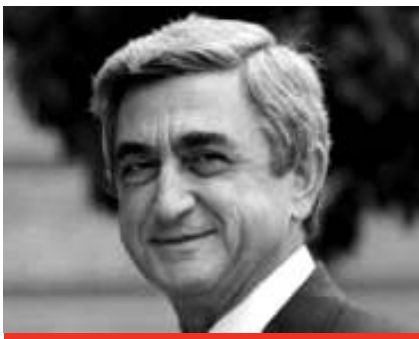
La victoire du nouveau président fait l'objet de contestation

M ardi 19 février à 8 heures, sous la surveillance de 600 observateurs étrangers et d'émissaires d'organisations européennes dont ceux de l'OSCE, 2, 328 millions d'électeurs étaient invités à déposer leur bulletin dans les 1 923 bureaux de vote des 41 districts électoraux que compte le pays pour élire son nouveau président, le président sortant Robert Kotcharian, au pouvoir depuis dix ans, ne pouvant se représenter après deux mandats successifs.