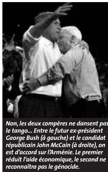
Non, les deux compères ne dansent pas le tango... Entre le futur ex-président George Bush (à gauche) et le candidat républicain John McCain (à droite), on est d'accord sur l'Arménie. Le premier réduit l'aide économique, le second ne reconnaîtra pas le génocide.

Concernant les aides militaires, le Président souhaite accorder trois fois plus d'aide internationale pour l'enseignement et l'entraînement militaire à l'Azerbaïdjan (900 000 $) qu'à l'Arménie (300 000 $) ce qui n'était pas prévu dans les accords de 2001 qui stipulaient que l'aide militaire devait être la même pour les