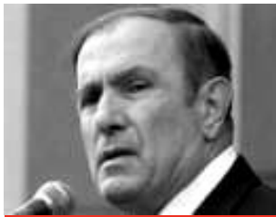
Lévon Ter Pétroussian a du mal à accepter sa défaite

Après une bataille sans ménagement entre les candidats, on peut penser que l'Arménie a préféré la stabilité à l'aventure, l'avenir au passé, en faisant confiance au slogan du Parti Républicain de Serge Sargsian « En avant l'Arménie » (Haratch Hayasdan). Mais, fait inquiétant, depuis le 20 février, Ter Petrossian, qui a mal accepté la défaite, appelle la population à des manifestations quotidiennes pour exiger l'annulation du résultat de l'élection, avec tous les risques de dérapage que cela comporte comme on l'a vu en Géorgie.